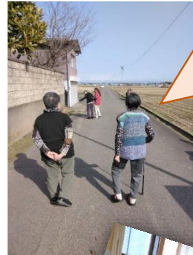
晴れた日は慶寿苑の周辺をお散歩。「お花がきれいだね～」「暖かいね～」とおしゃべりしながら歩きました！