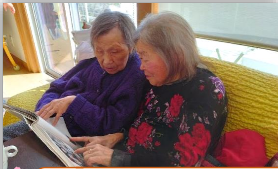
ぽかぽか陽気の中でのんびり読書タイム 慶寿苑にはたくさんの本や雑誌があります☆

田んぼのあぜ道につくしが顔を出し、春の花が咲きはじめ鳥たちも柔らかい芽や虫等を食しにきています。待ちわびた春の到来を皆様と一緒に喜び、暖かい日差しを浴びて元気に過ごしてまいりましょう。お花見ドライブに出かける予定もしておりますので、お楽しみに～！今月も宜しくお願い致します。