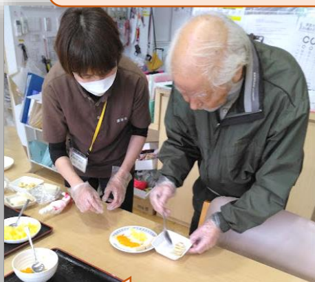
お誕生日会のおやつを！ 手作りで楽しんで頂きました😊 フワフワの！フルーツサンド😊🍴 美味しくて大好評でした～！